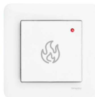
Ved lokal alarm vil lysdiode være tent.